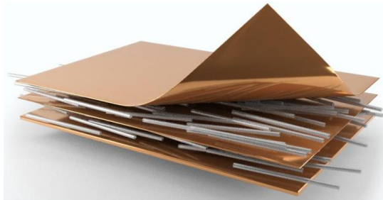
铜-碳纳米复合材料

美国橡树岭国家实验室的科学家利用新技术制造了一种复合材料,该材料可以提高铜线的电流容量,提高电动机和电力电子设备等部件的性能和寿命。